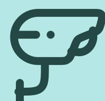
Фото и видеофиксация для контроля за оборотом строительных отходов